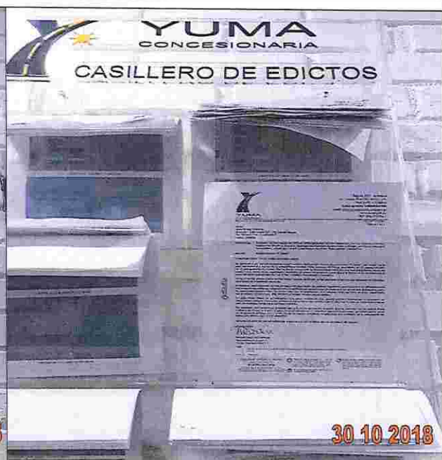
EDICTOS DE LA P_04507 YC-CRT-73297